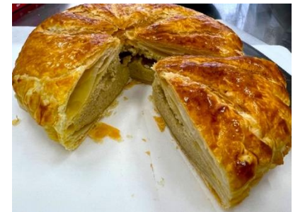
越前そば粉ガレットデロワ

福井県大野市の六呂師高原は、日本で最も美しい星空が広がる場所として認識されています。肉眼での天の川観察が可能で、流星群の時期には無数の流れ星を夜空に見つけることができます。星空観光は六呂師高原の主要な魅力で、その拠点の一つがミルク工房奥越前です。ここでは星空ハンモックなどの星空観光イベントが人気を博しています。しかし、星空観光は天候による影響を受けやすいという課題があります。星空が見えない日でも六呂師高原の魅力を感じてもらうために、私たちは地元の食材を活用したメニュー開発に取り組んでいます。ここで特筆すべきは、このメニュー開発に環境食品応用化学科の学生が主体的に参加しているという点です。学生たちの活躍が、星空観光の魅力を補完し、参加者の満足度や次回訪問への意欲の向上につながると期待しています。