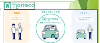
(左) 福井県庁岩井様による説明 (右上) 発表スライド例 (右下) 別チームの発表スライド例

経営情報学科政策システムコース2年生向けのPBL科目「FUT 実践学演習基礎」では、福井県庁カーボンニュートラルディレクターの岩井渉様をお招きし、福井県の脱炭素施策等についてお話しを伺うとともに、9チームに分かれて脱炭素まちづくりについてのディスカッションを行いました。その後各チームは、福井県内の地域課題を解決するアイデアを構想、検討を重ね、学期末のグループ発表に繋げました。