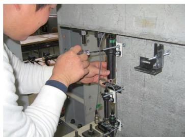
鉄筋コンクリートの実験（計測器取付）