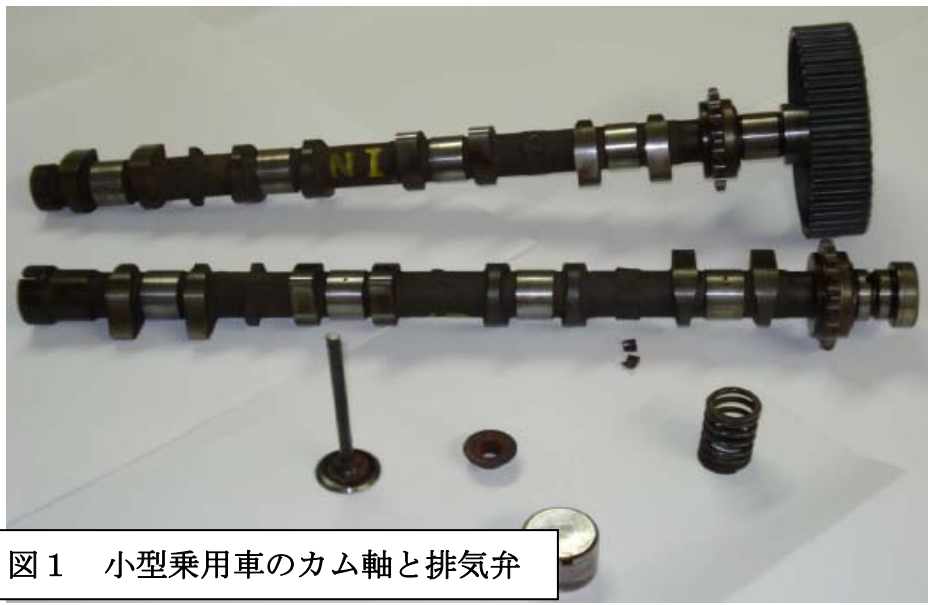
図1 小型乗用車のカム軸と排気弁