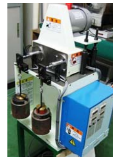
図3. 4連式回転曲げ疲労試験機 4本の試験片(裏側にも2本装着可)が同時に試験できる。