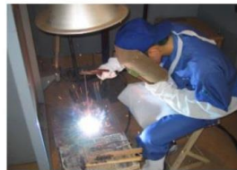
アーク・ガス・TIG 溶接の作業