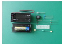
LEDライトの製作。完成品はお持ち帰り