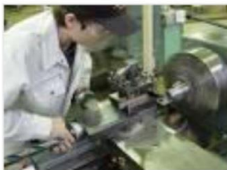
コマの製作。完成したコマはプレゼント